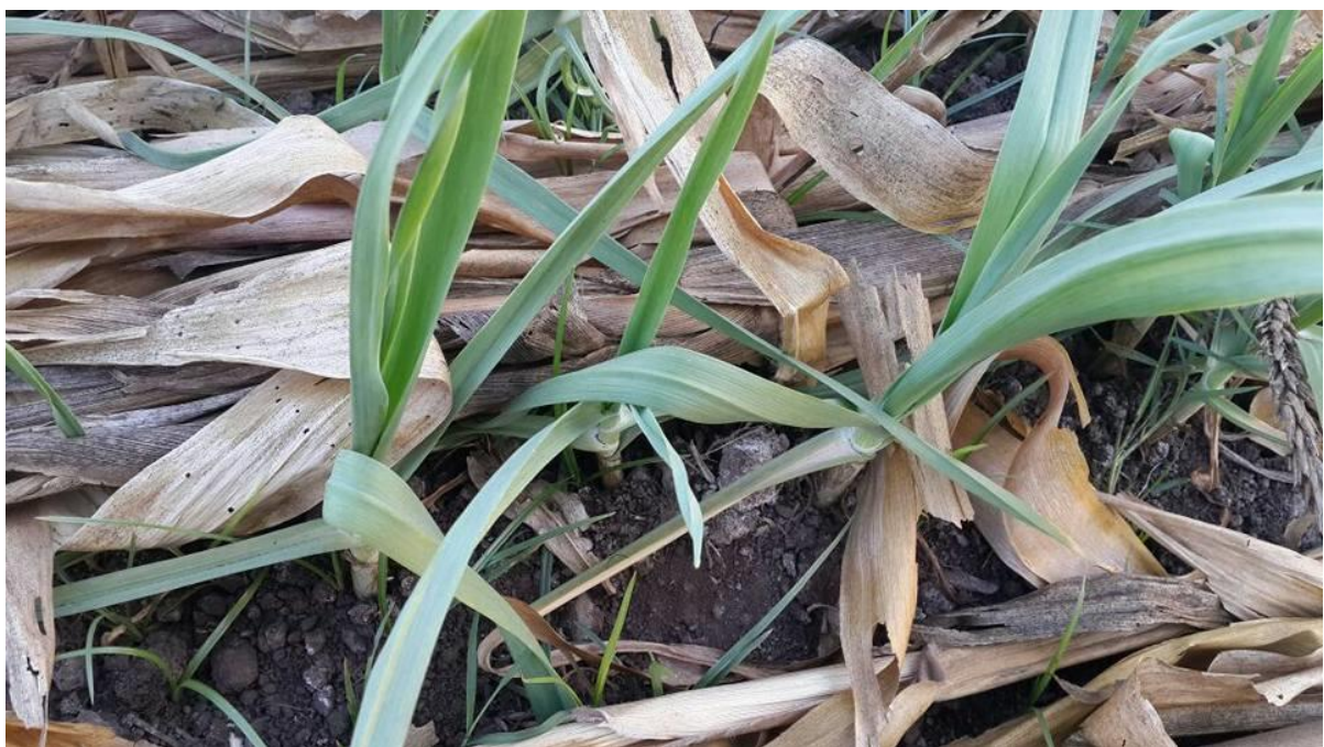
Figura 4. Detalhe da vista do campo de multiplicacao de semente de alho em campo aberto no vale do Umbeluzi, campo de producao de Manuel Matua, irrigada gota a gota.