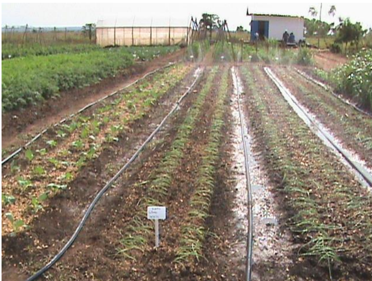
Figura 9. Vista da Vitrine de Tecnologias da Horticultura na Unidade de referencia na Estacao Agraria de Umbeluzi. Priorizada Cebola.