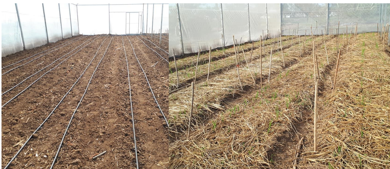
Figura 10. Vista da construção da estufa com efeito guarda chuva, filtro ultra violeta e antiafídeo. Pronta para a produção de alho geração zero.