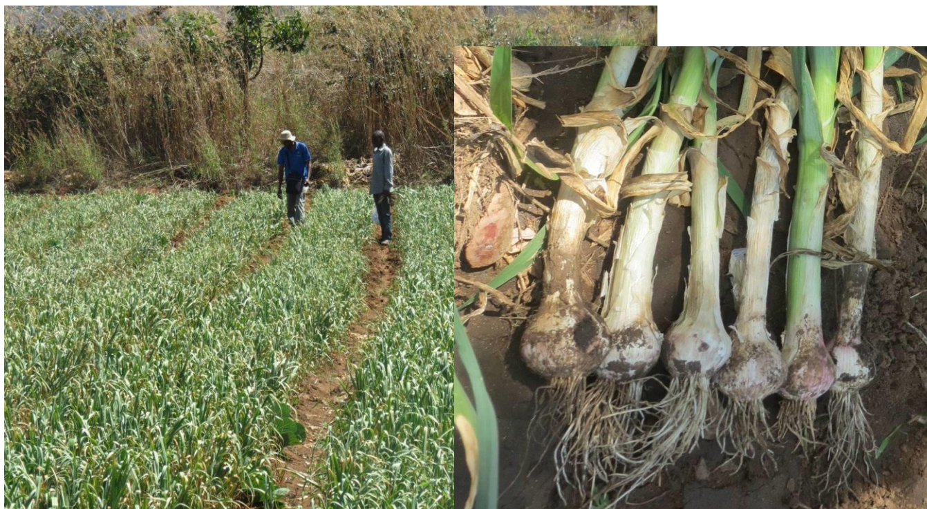
Figura 5. Vista de campo de producao de semente de alho em Metacusse – Malema.