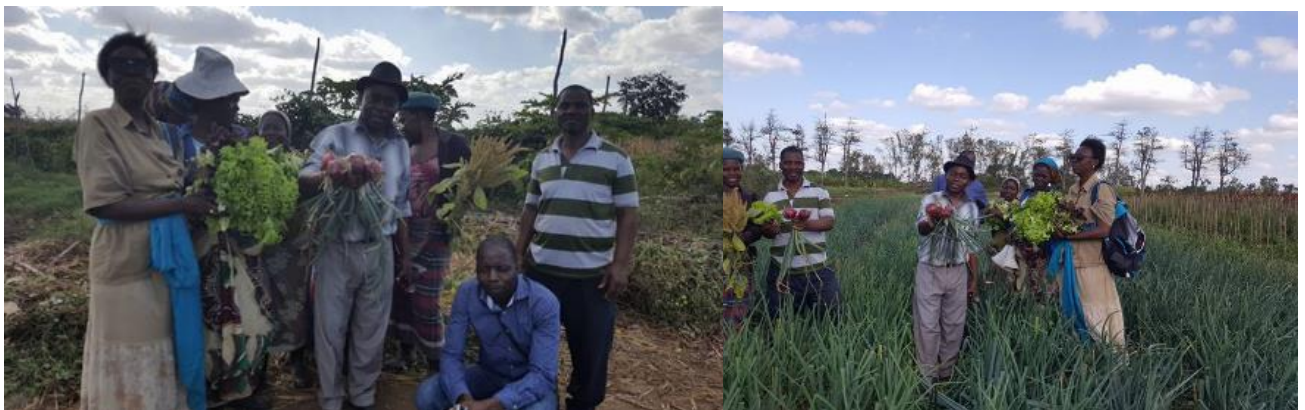
Figura 7. Vista dos agricultores dos Vales de Umbeluzi e do Rio Movene, em treinamento.