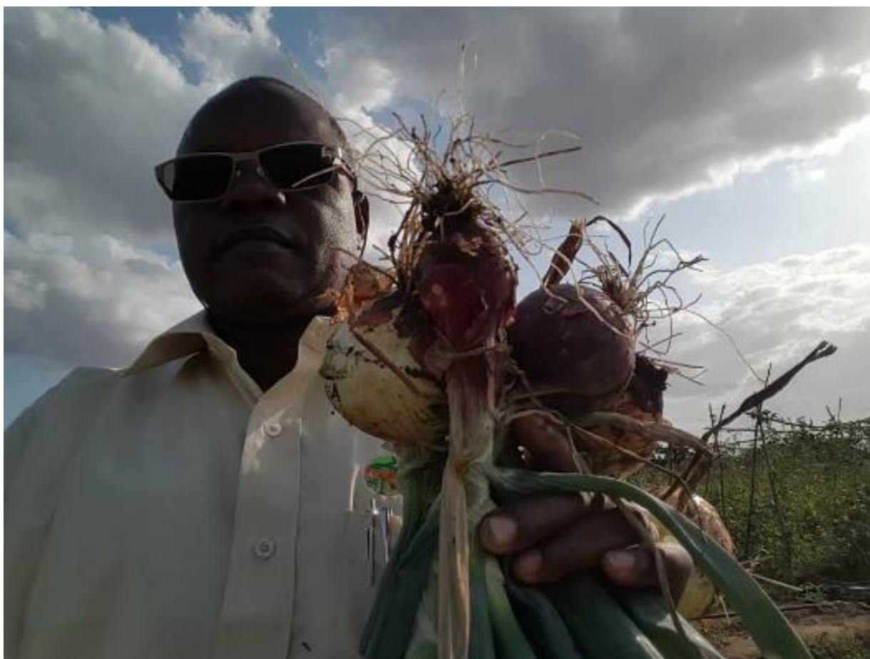
Figura 7. Vista do desempenho agronomico e qualidade da cebola das duas importantes variedades, a IPA 10 e IPA 11, colhidas na Estacao Agraria de Umbeluzi.