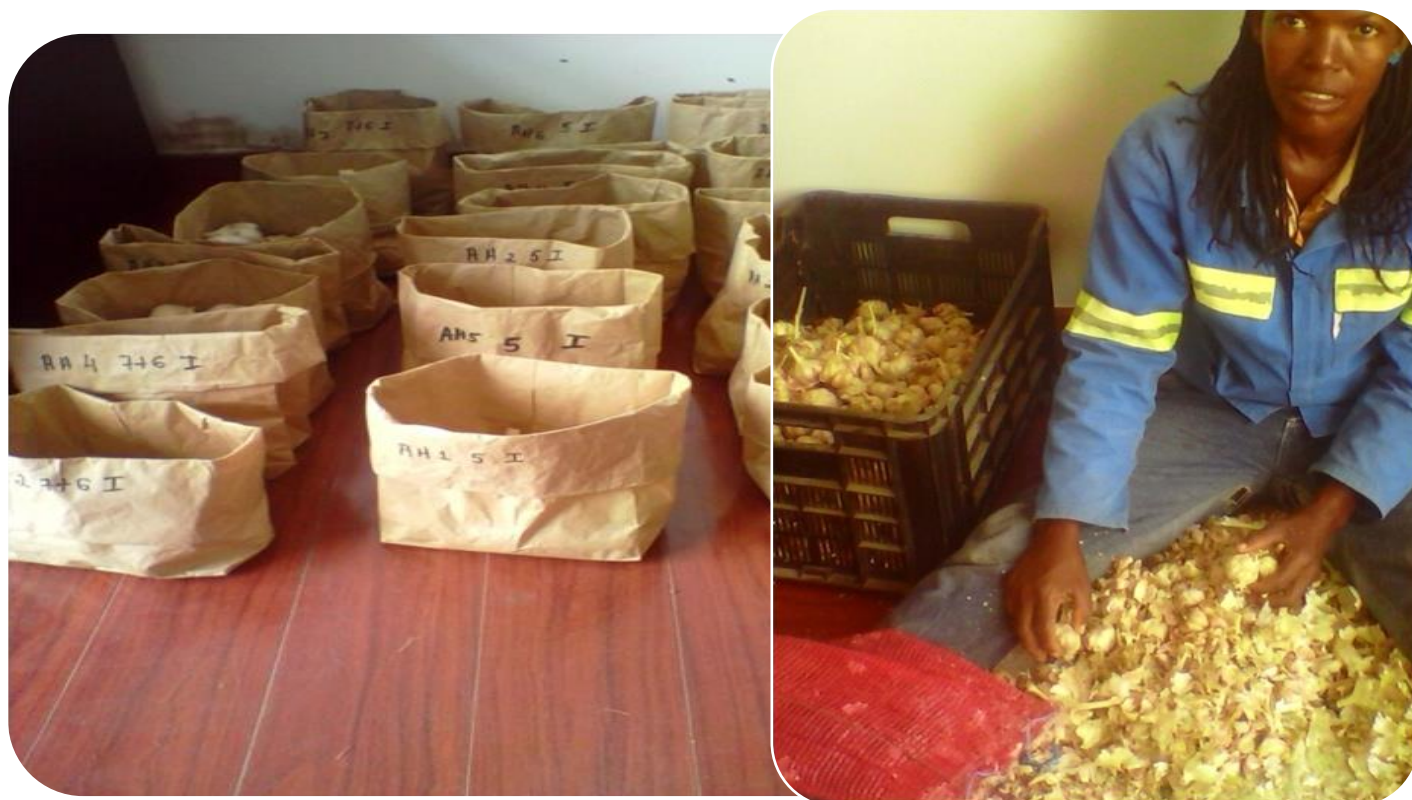
Figura 4. Vista do ensaio de pos colheita de alho. Avaliacao no CITTAU – Maputo.

• Publicados artigos científicos para partilha das experiencias com outros investigadores ou entidades interessadas na cebola e alho. Os relatorios tecnicos agronomicos de cebola e alho para a libertacao das variedades em Mocambique, constituem a responsabilidade do grupo de pesquisa no exercicio desta accao.