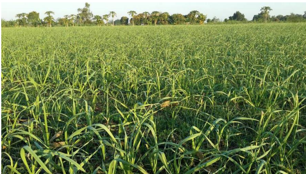
Figura 3. Vista Geral do campo de alho, var. BRS Hozan – Producao de sementes de alho livre de virus em Boane, Vale do Umbeluzi.