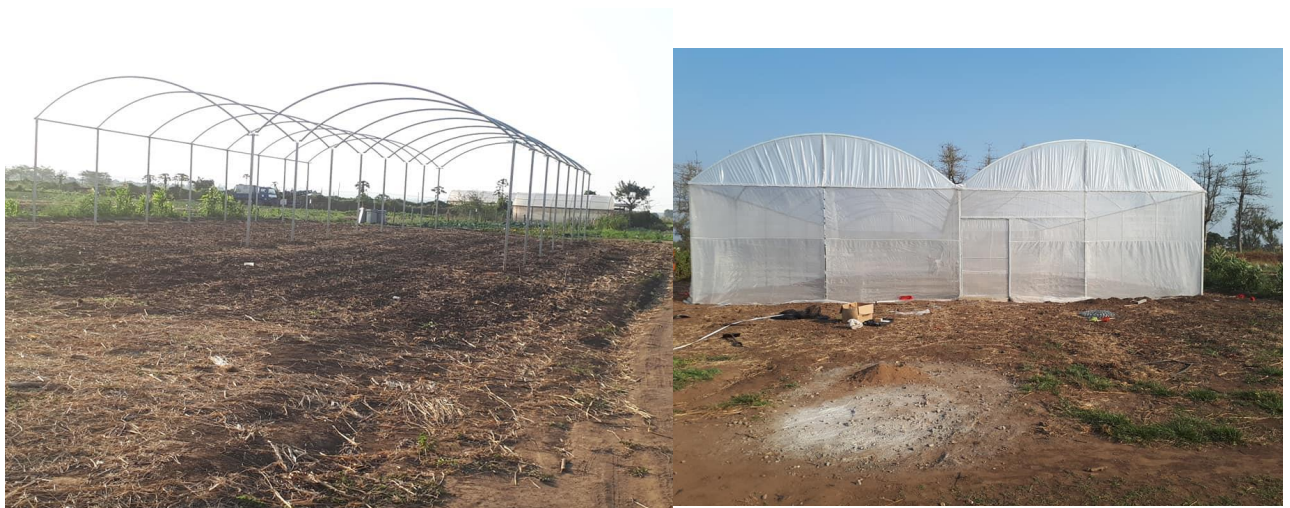
Figura 2. Vista da construção de estufas geminadas com tela antiáfida para a produção de semente de alho livre de vírus na Estação Agrária de Umbeluzi.

Dois investigadores do IIAM e que trabalham em Laboratório de Biotecnologia e Cultura de tecidos em Nampula e Maputo, foram enviados ao Brasil, para junto da EMBRAPA Hortícolas aprenderem a técnica de extracção de gemas e clonagem para a obtenção de plantas de alho livres de vírus. Essa tecnologia, deve culminar com a produção do primeiro alho livre de vírus de Moçambique, obtido in vitro . As plantas de alho oriundas da cultura de tecidos, serão endurecidas em estufas livres de sugadores e a garantia de ambiente livre de sugadores foi exercida em estufa telada com rede antiáfida, onde plantas indicadoras como Datura stramonium , foram plantadas (Figura 2). Os primeiros agricultores receberam na campanha 2017/2018, semente básica de alho para a produção de semente certificada com baixo teor de unidades formadoras de colónias de vírus (Figura 3, 4 e 5). Essa semente, ainda se manteve com níveis de produtividade na faixa dos 93 a 95% do potencial da cultivar ou variedade, o que mantém os níveis de produção e productividades ainda bastante bons (Licini, 2011).