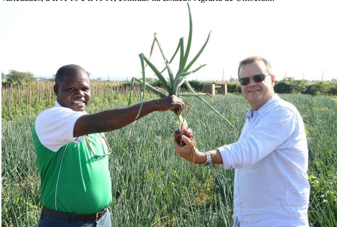
Figura 8. Vista da cebola implantada na Estacao Agraria de Umbeluzi. O Embaixador Rodrigo Baena, veio testemunhar e fez questao de deixar registada a sua presenca.